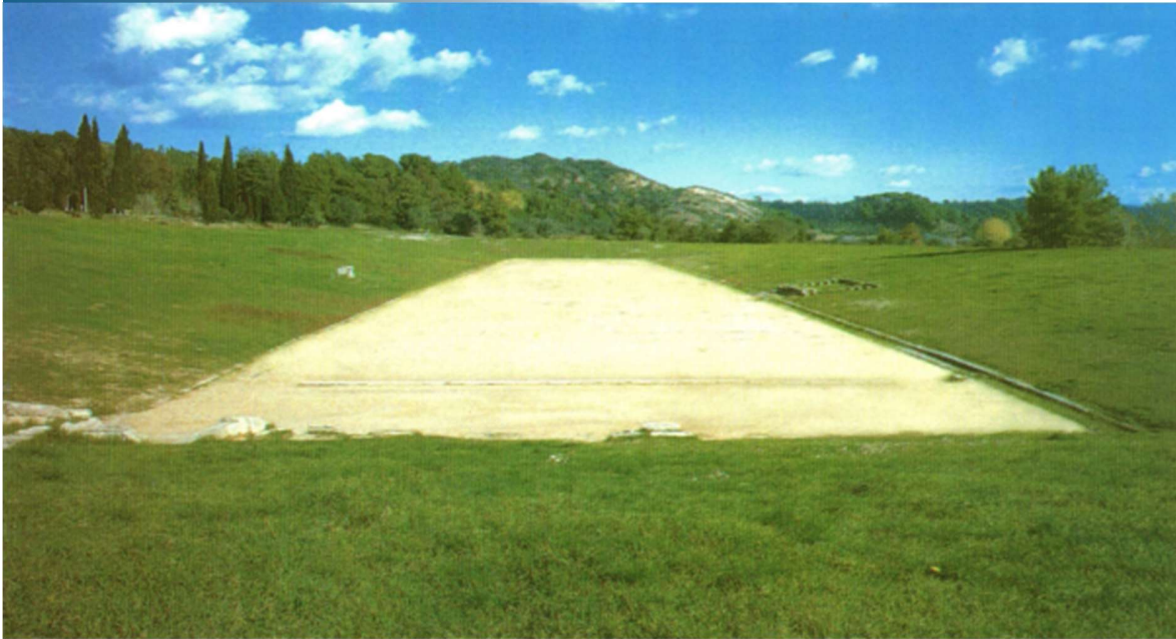
Στη φωτογραφία το στάδιο που διεξάγονταν οι αγώνες στην Αρχαία Ολυμπία.