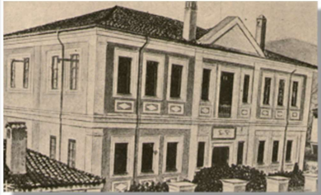
Η «Νίκειος» Σχολή στο Νυμφαίο